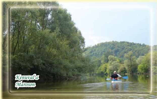
Kenuzás a Maroson

Arad megye egyik jellegzetessége a Maros folyó és környezete, kenuzásra és kerékpározásra csábítja a látogatót, hogy megtapasztalja e táj sokoldalú szépségeit.