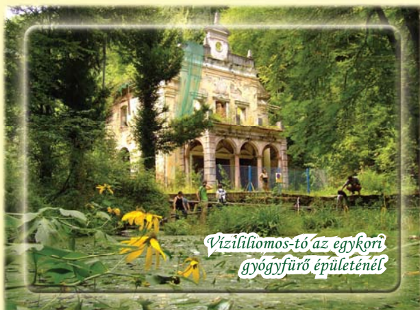
Vízililiomos-tó az egykori gyógyfürdő épületénél

Az Erdélyi-érchegység gyöngyszemeként is emlegetett Menyháza és az onnan kiinduló gyalogtúra útvonalak, bármely korosztályba tartozó turista számára könnyedebb túraélményeket ígérnek. Aki látni szeretné, hogy az egyes évszakok milyen változatosságot mutatnak Arad megyében, annak bármikor érdemes ellátogatnia e vendégeit télen-nyáron fogadó népszerű üdülőhelyre.