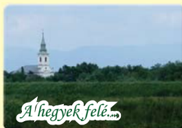
A hegyek felé...

~ Ahol a Gyulaváriból Dénesmajorba tartó út Mályvádi Árvízvédelmi Szükségeltározó gátja mellé kanyarodik, onnan számítva a 0,9 km-re lévő töltésátljárón tudunk a Gyulai vártól piros sávval jelzett turistaúton belépni a mályvádi erdőterületekre. Az eredei túra számtalan élményt kínál: a gazdag vadállomány, a zengő madárdal, az egykori folyóágak tükrai mind-mind a természetjárók megbecsült kincsei. Az átljárótól számítva a jelzett túraúton 4,8 km-re érjük el a Bányaréti östölgyes felé induló piros kereszt leágazást, mely alig 200 méteres kitérőt jelent csupán. Az östölgyestől északi irányban, akár a folyó egészen közel lévő gátjához is kísérelhetünk és folytathatjuk azon utunkat. A piros sávval jelzett út az östölgyestől az erdőben halad tovább a gáttal párhuzamosan és a sítkai részeknél csatlakozik csak ki a gáthoz. Innen már a gáton haladhatunk Gyula-Városerdő felé.