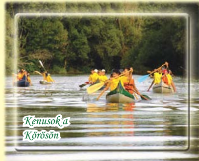
Kenusok a Körösön

A Kettős-Körös vadregényesen szakasza Békés és Köröstarcsa között lenyűgöző környezetbe invitálja a természetkedvelő embert. A túra során a folyószabályozás és az árvízvédelem múltja is megismerhető a kb. félúton lévő Bodoky Károly Vízügyi Múzeumban, a Hosszúfoki gát- őrház szomszédságában. (Kenuból a kiszállást a folyó jobb partján, a 14. folyamkilométernél úszóstég teszi lehetővé.) Az izgalmas árvízvédelmi múlt megtekintése után folytathatjuk utunkat a folyó természetesen kanyargós szakaszán Köröstarcsáig. A kikötő büféjében feltölthetjük étel- és italkészleteinket, majd érdemes megtekinteni a 2500 fős község főbb nevezetességeit – a Népi Kulturális Ökocentrumot és Tájházat, a református templomot, valamint a Szövőház és lovasudvart. (A nevezetességek igény szerint a kikötőből lovaskocsival is megtekinthetők.) Hívogató élmény kerékpárral a Kettős-Körös bal- és jobb parti gátkoronáján akár teljes körtúrát tenni, vagy a kenutúra után levezetésképpen visszarikáznai Békés-Dánfokra.