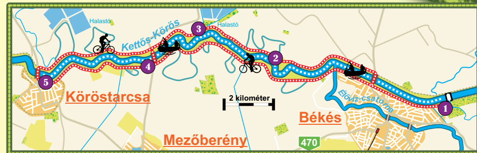
A Kettős-Körös gátján