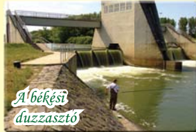
A békési duzzasztó

80-100 kenus indul útnak Köröstarcsa felé. ~ A Békés-Dánfoki Üdülőközpont a folyamatos fejlesztéseknek köszönhetően a térség kiemelkedő turisztikai bázisa. Szabadstrand, sportolási, étkezési- és szálláslehetőség, valamint kulturális programok gondoskodnak az élményekről.