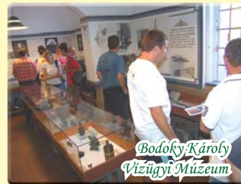
Bodoky Károly Vízügyi Múzeum

~ A Kettős-Körös medrének legmélyebb pontja a Kis-Sózugnak nevezett kanyarban található Hosszúfok közelében. A 10 méteres