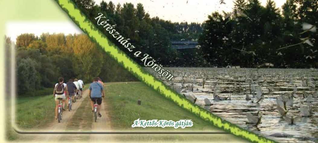
Kerékmás a Körösön

~ A Bodoky Károly Vízügyi Múzeum gyűjteménye feltárja a folyószabályozás és a korabeli árvízi védekezés monumentális feladatait, vállalásait, muzeális értékű gépeit és eszközeit.