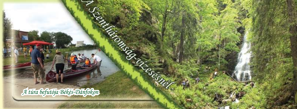
A túra befutója Békés-Dánfokon

~ A hegylábak közelében lévő, akár kerékpártolva is könnyen megmászható kiemelkedésekről gyönyörű panoráma nyílik a tájra, az előttünk és mögöttünk lévő Bihar- és a Béli-hegység vonulataival. Ilyen kilátók a Belényesújlaknál lévő „Pontoskő” és a 13. századi klastrom torony dombja Belényesszentmiklósnál.