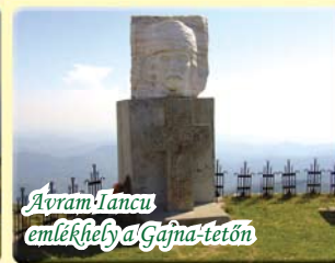
Avram Iancu emlékhely a Gajna-tetőn

Zarándbányánál (Bănești) számos ház már lakó nélkül várja további sorsát, vagy csak a nyári hónapokban lakottak. A kertekben még ma is termő, öreg alma- és kőrtefák idézik a múlt emlékeit. A Gajna (Găina) tetőről rövid észak-nyugati sétával érhető el az Arad sziklája (Piatra Aradului) (1429 m), közvetlen a három megye Bihar, Fejér és Arad megyék csomópontjában. Innen délkeletre, 1486 m-en emelkedik a Gajna (Găina) hegycsúcs, Arad megye legmagasabb pontja. A vonulattól északra a Bihari hegyvidék, nyugatra a Béli hegység (Codru Moma), délnyugatra a Zarandi-hegyek nyújtanak tiszteletreméltó látványt.