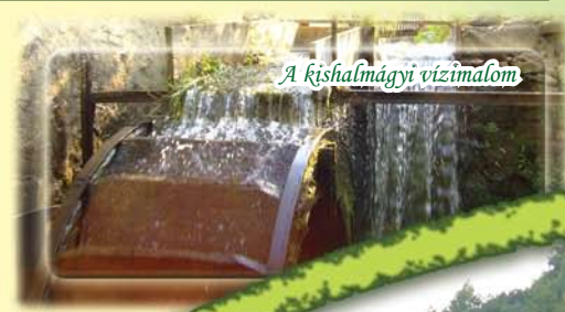
A kishalmágyi vízialom