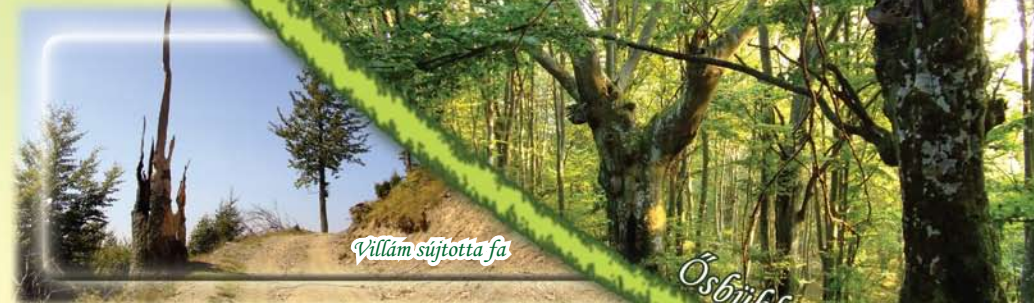
Villám sújtotta fa